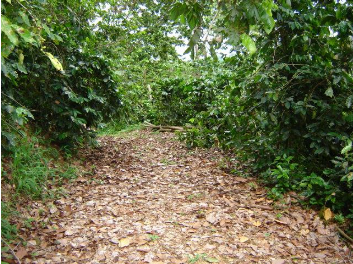
Café Bajo Sombra en Utuado