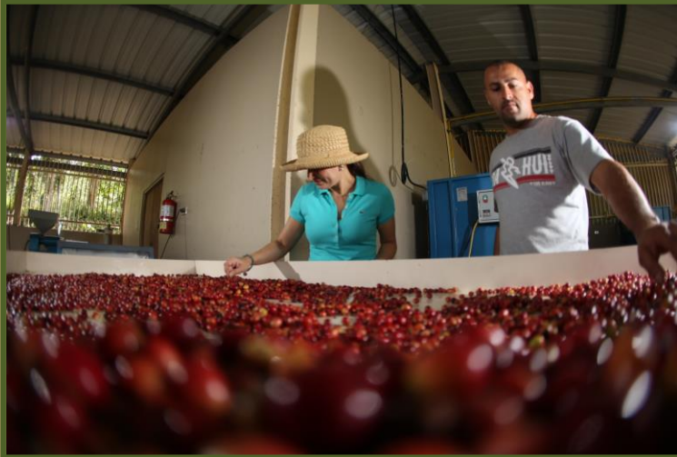
Café Lucero, Ponce