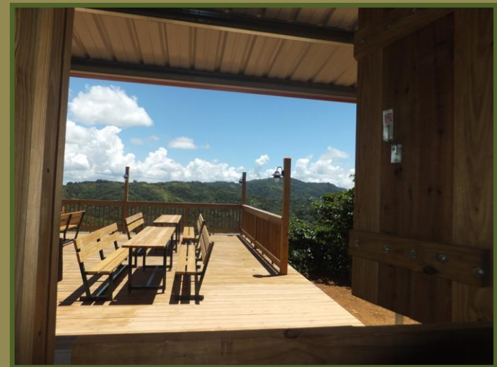
Hacienda Tres Angeles, Adjuntas

DIVISIÓN DE TURISMO SOSTENIBLE COMPAÑÍA DE TURISMO DE PUERTO RICO