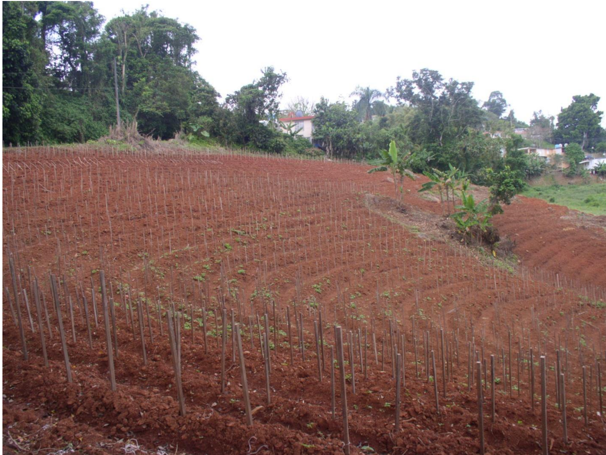
Siembras al Contorno en Corozal